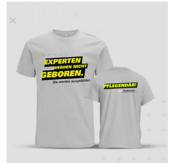
T-Shirt Experten Anzahl: