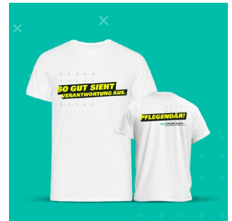
T-Shirt Verantwortung Anzahl: